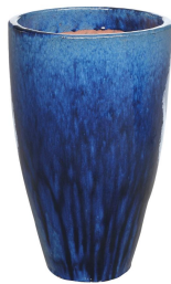
New Glazed Sandhal Rosenpot