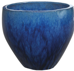
New Glazed Sandhal Bowl